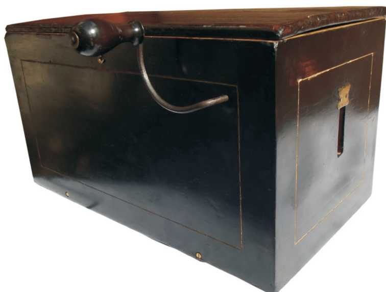
3. Melodion vergl , proizveo u Parizu majstor stolar iz Chilea, 1876. godine