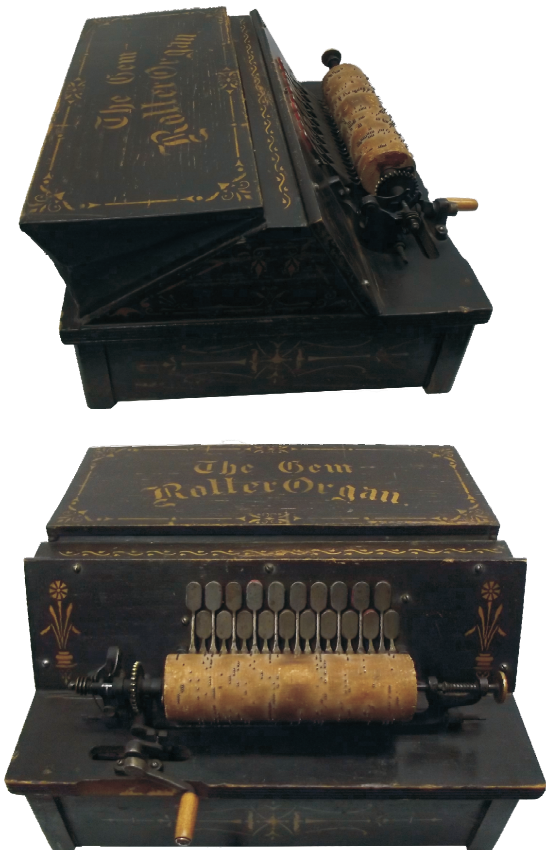
9. Gem Roller Organ, 1885. godina