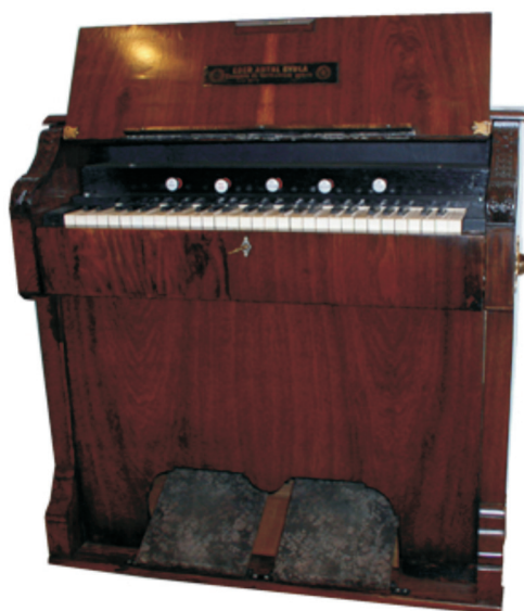
1. Harmonium majstora Eder Antal Gyula, Mađarska, period oko 1870.godine, na potisni zrak, s jednom igrom, 5 manubrija i 54 tipke

Devetnaesto stoljeće donosi potpuno nova saznanja o životu, životnoj filozofiji i tehnici. Klasična glazba u tom periodu dominira kvalitetom, kako izvedbe tako i ponude izražavanja te skladanim djelima. Stoga glazbeni automati nikada nisu postigli ni umjetničku, ni emocionalnu vrijednost.