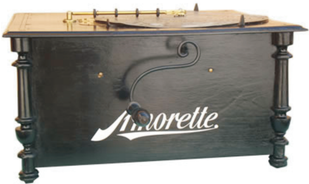
4. Amorette , 1895. godina, Leipziger Musikwerke Euphonika AG, Otto Bergmann