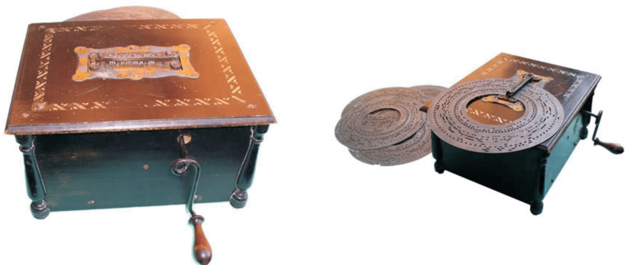
2. Intona , rađena u Njemačkoj, patentirana 1876. godine, proizvedena oko 1879.godine, iz radionice Leipziger Musikwerke Phönix Schmidt & Co., pokreće se ručno i koristi metalne ploče, dimenzija: 44,5 x 35 x 25,5 cm, ploča Ø 37 cm