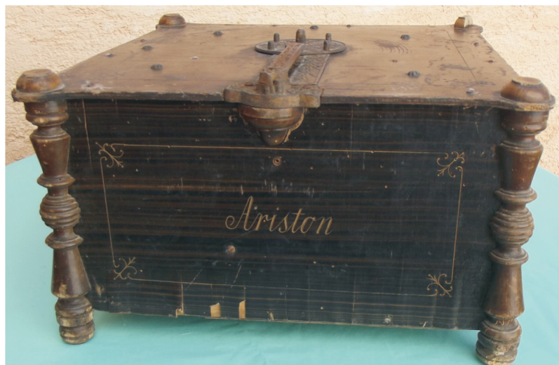
7. Ariston br. 7-10, 24 tona, prešpan ploče Ø 33 cm, cijena: 19,65-21,70 mark